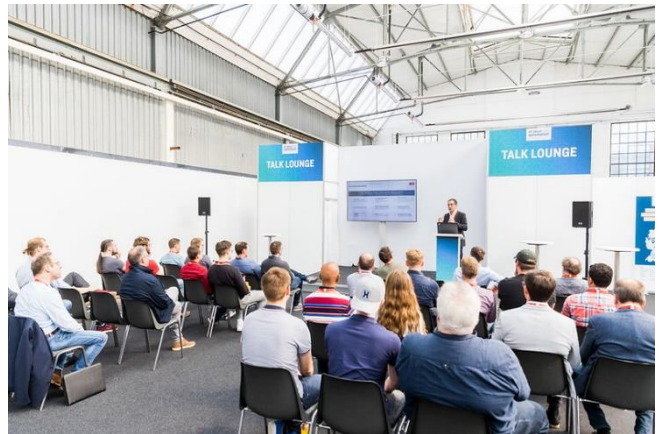
Direkt in der Messehalle und kostenfrei für alle Besucher: Die Vorträge auf der Talk Lounge der all about automation

Das Vortragsprogramm auf der Talk Lounge direkt in der Messehalle ist an der Praxis und dem was heute bereits möglich ist ausgerichtet. Es geht um realisierte Anwendungen für IIoT-Lösungen, Retrofit, Bin-Picking, Energieeffizienz und vieles mehr. Die Referenten zeigen mit ihrer großen Praxiserfahrung, welche Potenziale für den Einsatz von Methoden der Digitalisierung und Automatisierung es gibt.