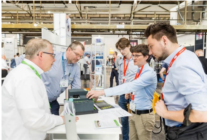
Erfolgsgarant auf den aaa- Messen: Die Qualität persönlicher Kontakte und die Lösungskompetenz des Fachvertriebs.

Ideengeber und Entscheidungshilfe, um Prozesse rund um die Fertigung effizienter zu gestalten.