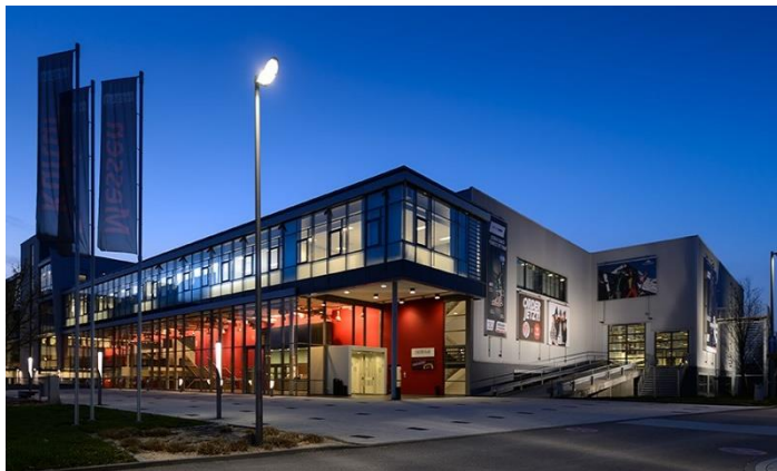
Es dauert nun bis 2022, bis die erste all about automation in der Redblue Messehalle Heilbronn stattfindet.

Die für den 5. + 6. Mai 2021 in Hamburg und den 19. + 20. Mai 2021 in Heilbronn geplanten all about automation Messen finden aufgrund der Corona-Pandemie nicht statt. Aktuell ist weiterhin unklar, wann und unter welchen Voraussetzungen Messen wieder möglich sind. Auch wenn das regionale Messeformat der all about automation weniger komplex ist, benötigt es für Besuchermarketingkampagnen und organisatorische Messevorbereitungen bei Veranstalter und Ausstellern mehrere Monate. Die fehlende Planungssicherheit führt jetzt